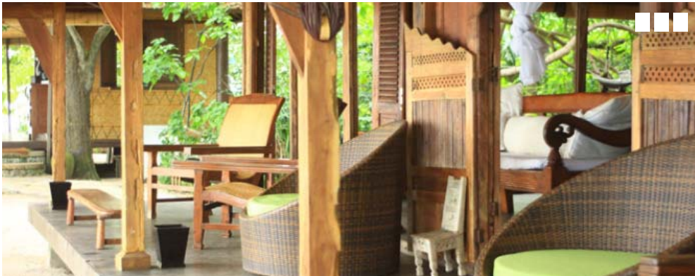
Isle East Indies A Petite Jewel in the Thousand Islands

Bagi kamu yang suka bersantai sambil menikmati santapan ringan, tersedia juga bale yang tak kalah nyaman untuk berkumpul sambil menikmati keindahan sunset. Pulau inipun dikelilingi oleh pepohonan yang membuat teduh seluruh pulau.