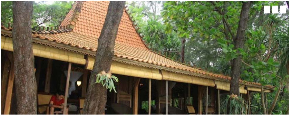
Isle East Indies A Petite Jewel in the Thousand Islands